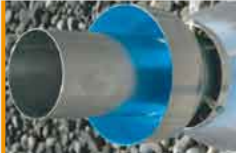
Trichter - Innenseite nass lackiert